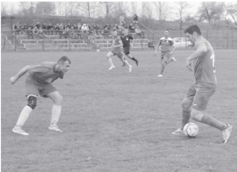
Izgalmas második féldőt játszott a két csapat.

A 2016-2017-es idényt Somosd 17 győzelemmel, egy Jeddenn elért döntetlennel és tízpontos előnnyel zárta, nem talált legyőzőre, míg Csíkfalva a negyedik helyen horgonyzott le már néhány fordulóval ezelőtt. A bajnokság a rájárással folytatódik.